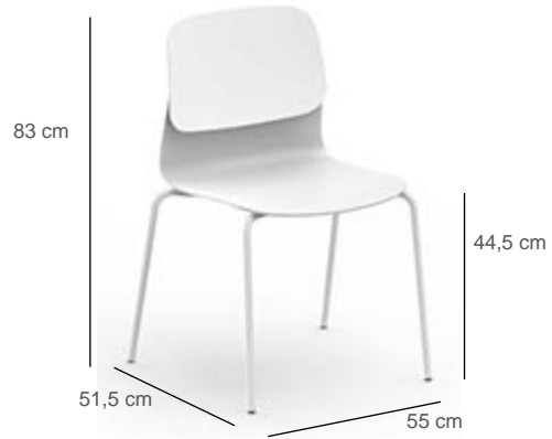
Pied métal L.55 x P.51,5 x H.83 cm - hauteur d'assise 44,5 cm

epoxia mobilier et aménagement de bureau