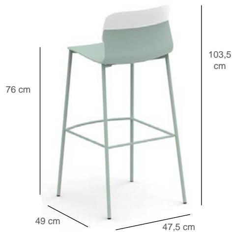
Pied métal L.47,5 x P.49 x H.103,5 cm - hauteur d'assise 76 cm