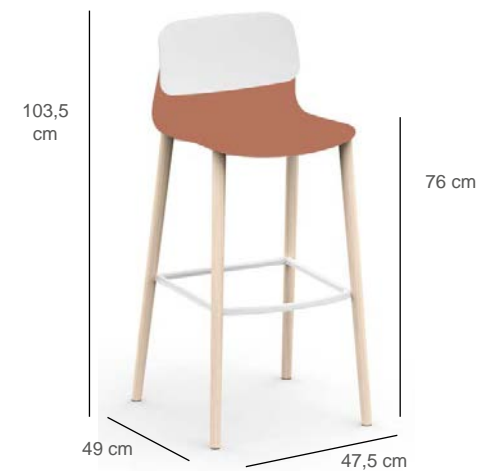
Pied bois L.47 x P.51 x H.103,5 cm - hauteur d'assise 76 cm