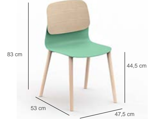
Pied bois L.47,5 x P.53 x H.83 cm - hauteur d'assise 44,5 cm