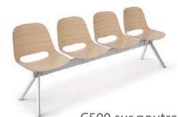
C500 sur poutre