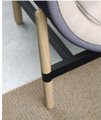
standard oak legs black powdercoated frame