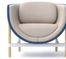
CAPSULE LOUNGE 1-SEATER