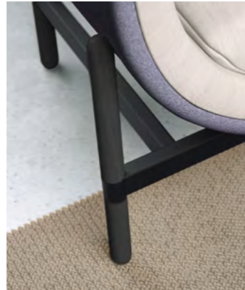
black varnished legs black powdercoated frame