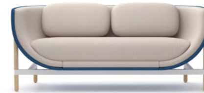
CAPSULE LOUNGE 2-SEATER