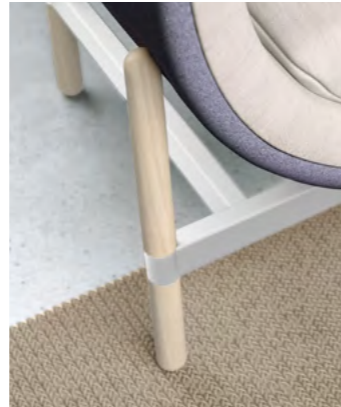
white wash oak legs white powdercoated frame