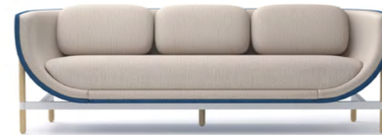
CAPSULE LOUNGE 3-SEATER