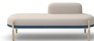
CAPSULE BENCH RIGHT/LEFT BACKREST 4236/08 - 4236/09