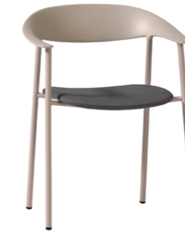
— Armchair with upholstered seat Sillón con asiento tapizado