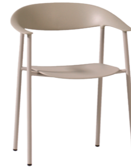
— Armchair Sillón