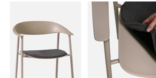
— Removable upholstered seat cushion Cojín de asiento desenfundable