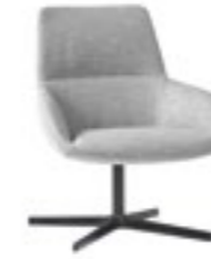
Medium backrest Respaldo medio