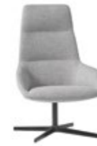
High backrest Respaldo alto