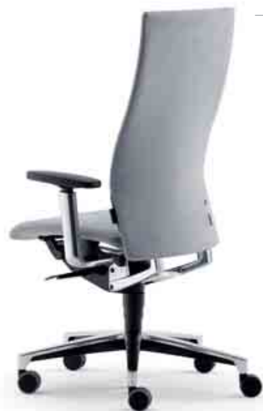
Klöber Ciello cie98 Bureaufauteuil met synchroonmechaniek en 4F-armsupports. Klöber Ciello cie98. Fauteuil synchrone avec accoudoirs 4F.

Zo eenvoudig in te stellen als de gesp van een riem: het gemakkelijk te verstellen mechaniek van de Ciello. Aussi facile à régler qu'une boucle de ceinture: le réglage rapide du fauteuil Ciello.