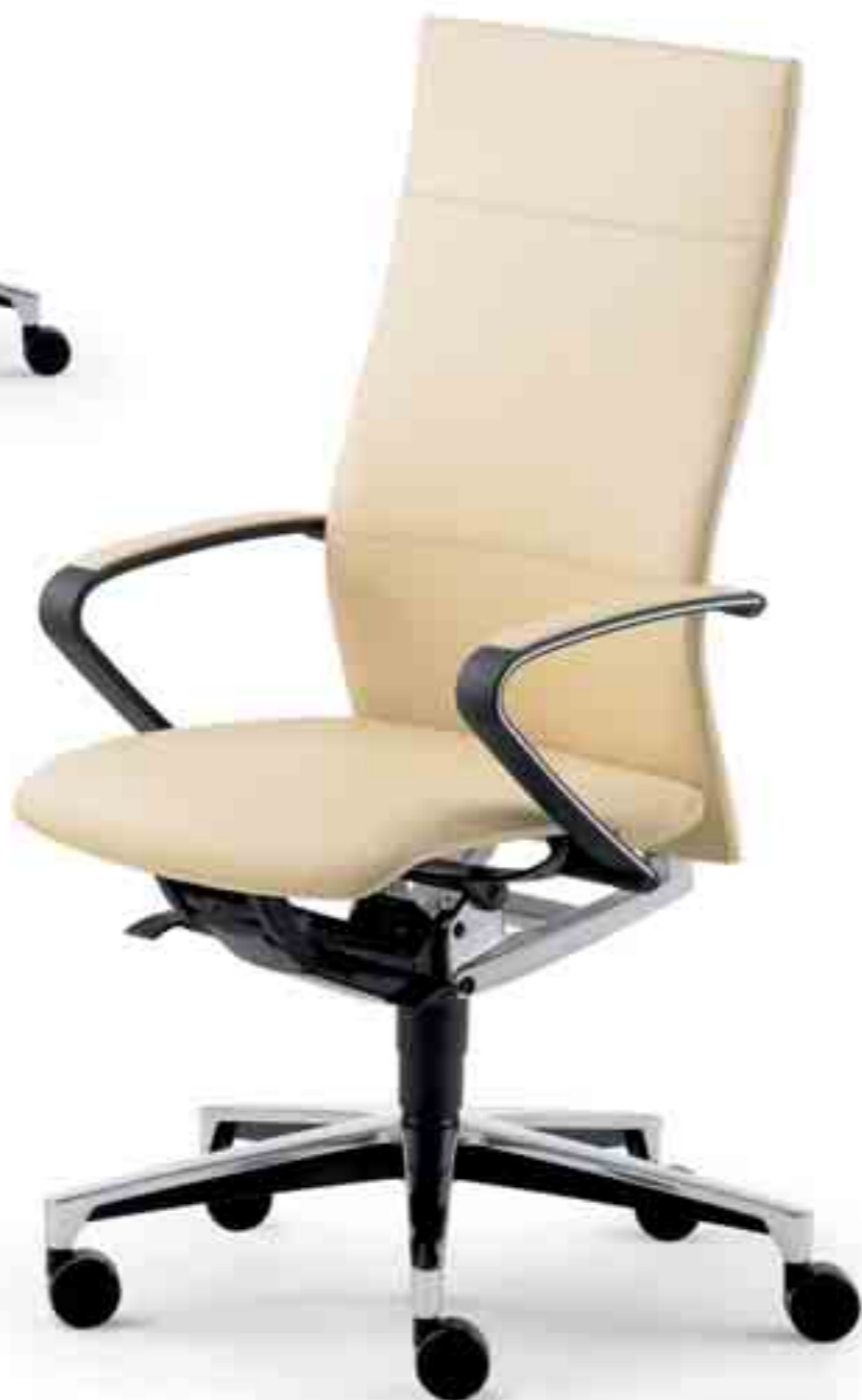
Klöber Ciello cie98 Bureaufauteuil met synchroonmechaniek en flexibele armleggers. Klöber Ciello cie98. Fauteuil synchrone avec accoudoirs articulés.

Zitten op maat. Ieder mens is anders en daarom gaat er achter de sierlijke Ciello contouren een techniek schuil, die rekening houdt met de verschillen tussen mensen. Met de gepatenteerde, gebruikersvriendelijke en snelle bediening wordt de Ciello met één druk op de knop ingesteld op het eigen lichaamsgewicht (in een bandbreedte van 45 tot 125 kg). Eenmaal ingesteld op de gebruiker ondersteunen zitting en rugleuning vanzelfsprekend alle bewegingen. Dankzij de gepatenteerde punt-synchroonmechaniek.